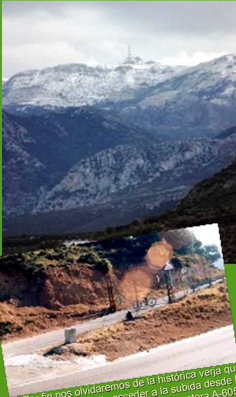
Por fin nos olvidaremos de la histórica verja que nos impedía acceder a la subida desde la carretera A-6050

La adecuación del pico es posible tras el convenio, enmarcado también en el Activa Jaén, firmado en septiembre de 2006 entre los ayuntamientos de Los Villares y Valdepeñas de Jaén y el Ministerio de Defensa, según el cual, el propietario de las instalaciones militares las cedía a los dos consistorios, de cuyos términos municipales forma parte La Pandera.