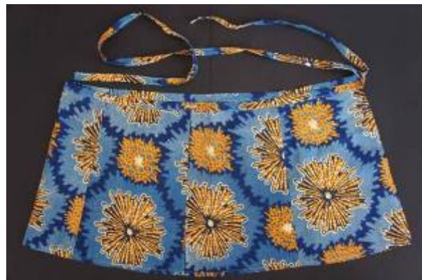
Falda/paño confeccionado con una o varias telas